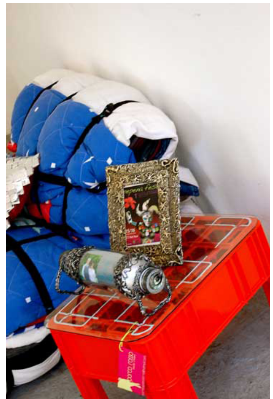
Pintura realizada sobre pieza de auto. Móviles hechos con cartón y lata. Objetos útiles realizados con pet, cartón, rejas de refrescos y ropa vieja.