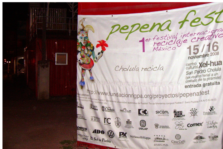
Muestra de programa, cartel y lona.