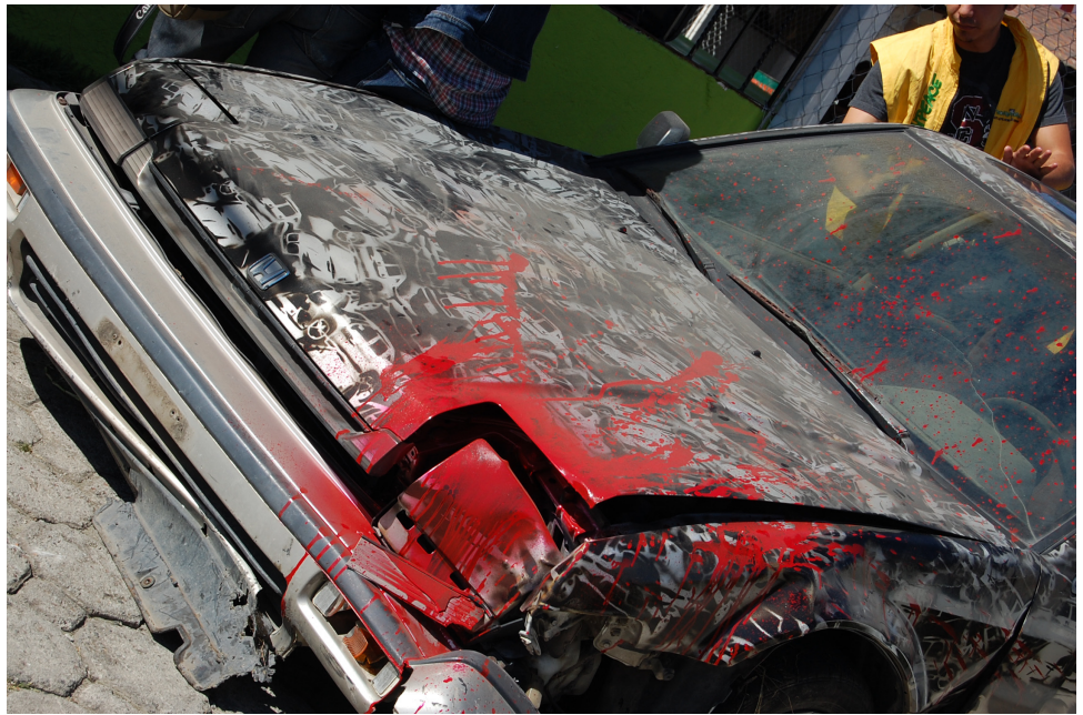
Sala diseñada para muestra audiovisual. Automóvil chatarra intervenido con stencil Wacha Vato